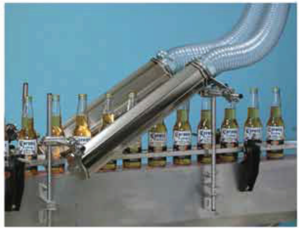
Asciugatura bottiglie in vetro Glass bottles drying

In Italy, the cost of 1 kW/hour is about 0,15 € which, multiplied by the saved energy, means 1.452 € of saved electrical energy!