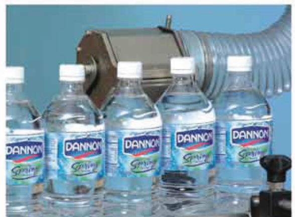
Asciugatura zona tappo Cap area drying