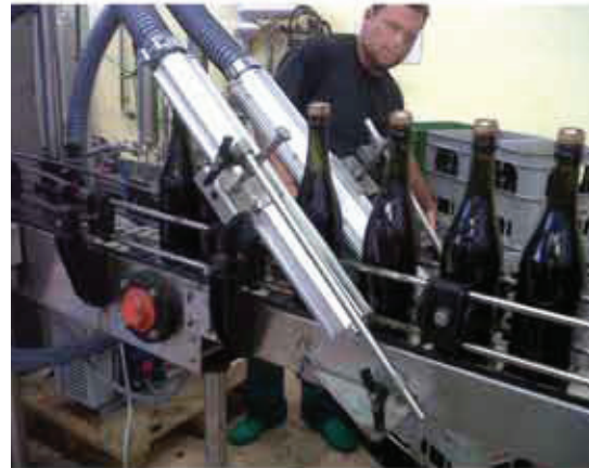
Asciugatura bottiglie vino Wine glass bottles drying