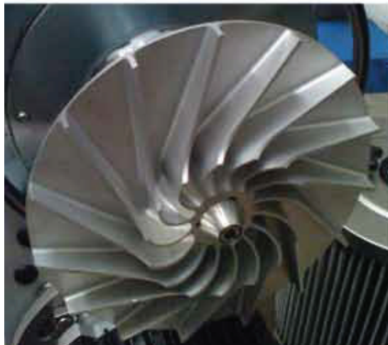
Girante in alluminio lavorata CNC Aluminum impeller CNC machined