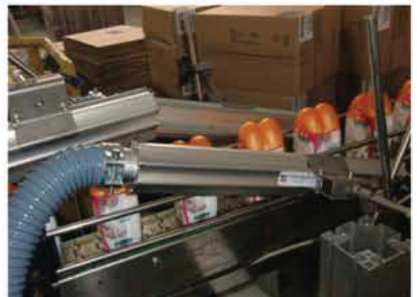
Asciugatura flaconi accoppiati da termoretraibile Plastic bottles drying coupled with thermo retractable film