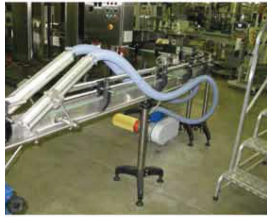
Sistema Republic installato su linea trasporto Republic drying system installed in a conveyor line