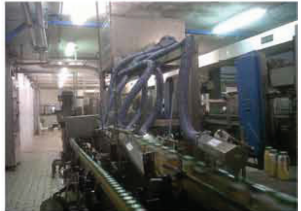
Asciugatura bottigliette succo di frutta Fruit juices bottles drying