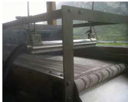
Tappeto in maglia inox per asciugatura frutta Stainless steel mesh conveyor for fruit drying