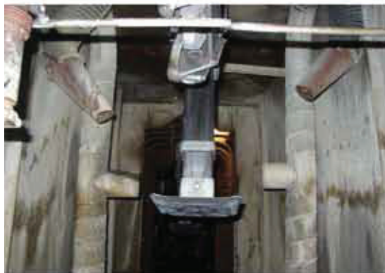
Pulizia pezzi prima della verniciatura Cleaning operation before painting