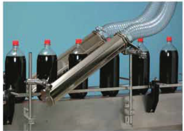
Asciugatura bottiglie PET PET bottles drying