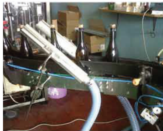
Asciugatura bottiglie vino Wine glass bottles drying