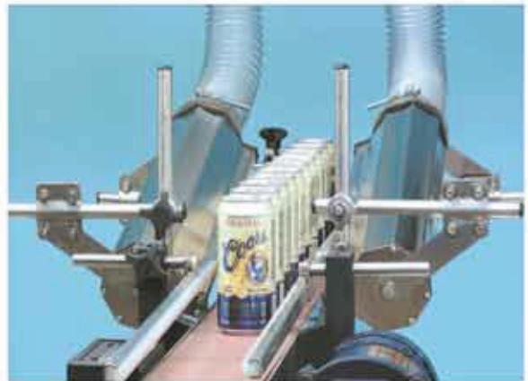
Asciugatura lattine in alluminio Aluminum cans drying