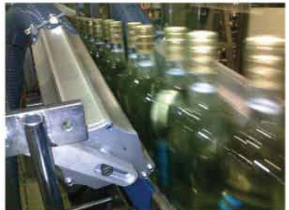
Asciugatura bottiglie di vino Wine glass bottles drying