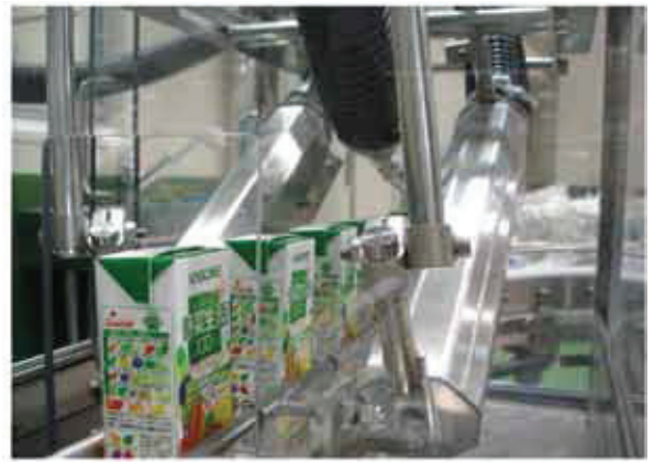
Asciugatura confezioni tetra pak Tetra pak drying

Several models are available, 6 sizes with 3 HP – 75 HP engines. Compact dimensions for an easy placement.